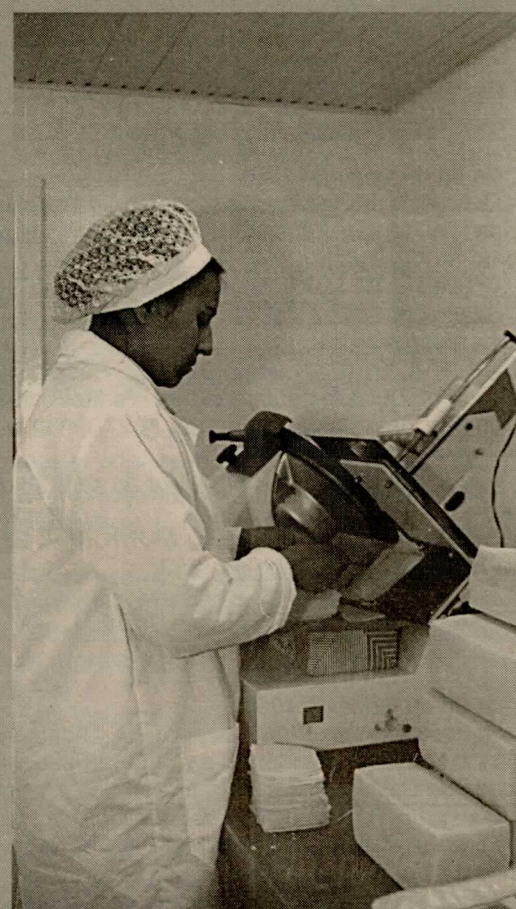
Empresa de fatiados pode processar 8 mil quilos ao mês