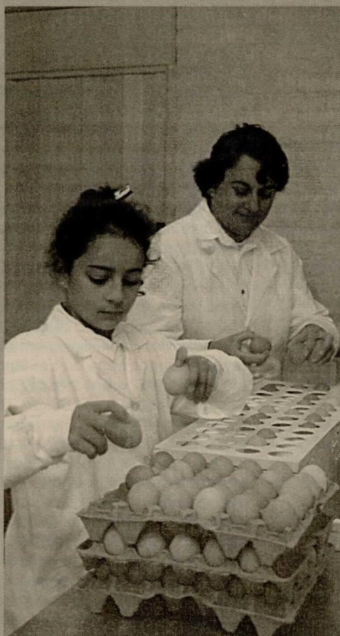
Selo do COPAS proporciona melhores vendas aos Trentin