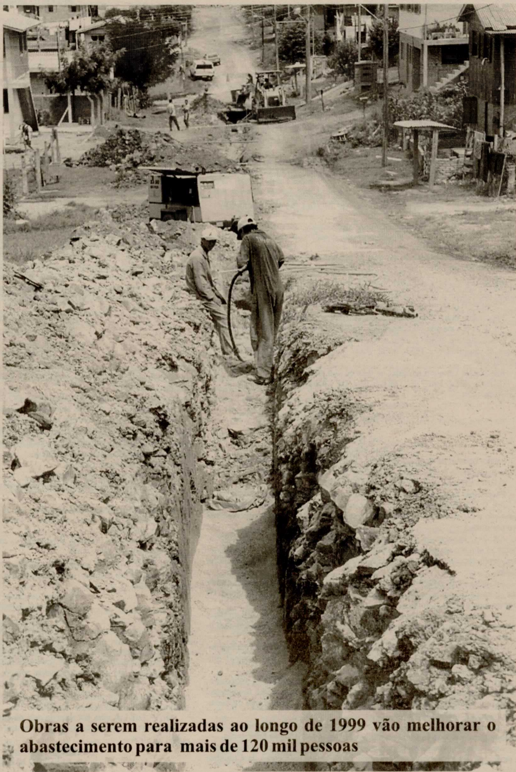
Obras a serem realizadas ao longo de 1999 vão melhorar o abastecimento para mais de 120 mil pessoas

Estão em construção as adutoras da Radial Sul (Esplanada), Tronco-Oeste (Desvio Rizzo), Maestra (Fátima) e Samuara (Forqueta). A do Diamantino (Cruzeiro/Presidente Vargas), com linha de financiamento através do Fundopimes, está em elaboração de projeto, com início previsto para maio. Estão sendo investidos mais de R$ 4 milhões. Com esses trabalhos, a meta da Administração Popular é melhorar o fornecimento de água para 120 mil pessoas até o final do ano.