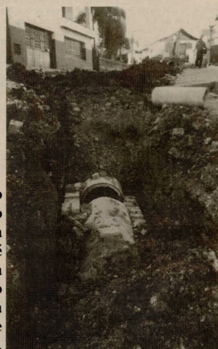
Canalização do esgoto pluvial na Rua René Colon era reivindicação antiga da comunidade do bairro.

toda a sociedade no centro das decisões. Pela primeira vez na história de Caxias do Sul, as pessoas participam das discussões e elaboração do Orçamento, estabelecendo o controle dos cidadão sobre o governo municipal.