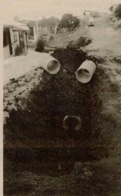
Vila Moderna já recebeu 1º obra do Orçamento Participativo.

A Administração Popular abriu na última quinta-feira, 26, na Central de Licitações, o edital para mais três obras do Orçamento Participativo. A prioridade escolhida pela população, a exemplo da atendida no último final de semana no Bairro Rio Branco, é saneamento básico. Nesta etapa, duas região serão atendidas: Centro (Bairros Panazzolo e Sagrada Família) e Fátima (Bairro Interlagos). Este trabalho prevê a instalação de 1.746 metros de rede de esgoto em áreas de alagamento. O investimento totaliza R$ 400 mil. A previsão da Coordenação de Relações com a Comunidade, responsável pela organização do OP, é de que no prazo máximo de 60 dias depois da abertura do edital as